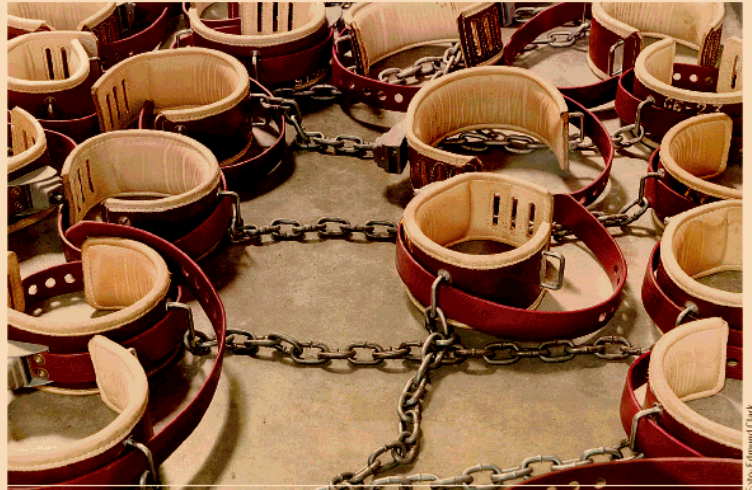
Desorientierung, Belastungsstörungen etc. sind das Thema von Edmund Clarks Guantánamo-Serie.

Mit dem geplatzten Glücksversprechen der Immobilienbranche in Spanien hat sich Sylvain Couzinet-Jacques beschäftigt. In einem abgedunkelten Raum werden Fotografien von Bauruinen starkem UV-Licht ausgesetzt ( Standards&Poors ), man darf nur mit einer entsprechenden Schutzbrille hinein. Im Laufe der Ausstellung bleichen die Bilder immer weiter aus, der Traum vom schnellen Geld platzt. Zynischer ist die Arbeit von Taysir Batniji. Er hat im Stil von Maklerbüros Verkaufsanzeigen für Wohnhäuser gestaltet, doch das Foto zeigt das